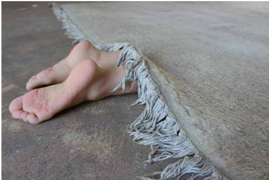
Laura Bottereau & Marine Fiquet ; Les vieux démons , détail ; 2018 ; installation, matériaux divers ; dimensions variables ; coproduction maison des arts, centre d'art contemporain de malakoff ; © Adagp, Paris 2018

(3) Sigmund Freud, L'inquiétante étrangeté (Das Unheimliche) 1919 traduit de l'allemand par Marie Bonaparte et E. Marty