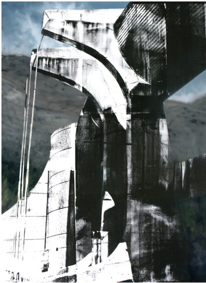
Eva Nielsen, Hydre , 2016 Huile, acrylique et sérigraphie sur toile, 200 x 150 cm Courtesy galerie Jousse Entreprise © Eva Nielsen

Potentielle), Jochen Gerner a participé à de nombreux projets d'expositions collectives et personnelles, et fut notamment lauréat du prix Drawing Now en 2016. Il s'engage aussi dans des projets éditoriaux (bandes dessinées expérimentales et dessins de presse).