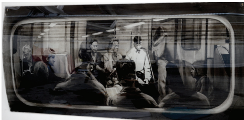
Lenny Rébéré, sans titre , 2017 Fusain et crayon sur papier, 70 x 100 cm Courtesy galerie Isabelle Gounod © Lenny Rébéré

Diplômée de l'École nationale des Beaux-arts de Paris en 2009, Eva Nielsen a réalisé depuis de nombreuses expositions collectives et personnelles, notamment en France. Ses œuvres ont été acquises dans plusieurs collections publiques comme le MACVAL (Musée d'art contemporain du Val de Marne), le Fonds Municipal d'Art Contemporain de Paris, le CNAP ou la collection de la Société Générale.