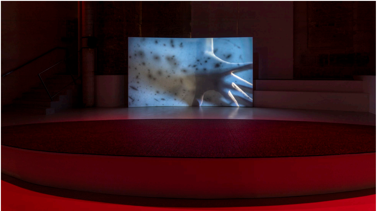
Caroline Corbasson, vue de l'exposition Ellipse , 2020.