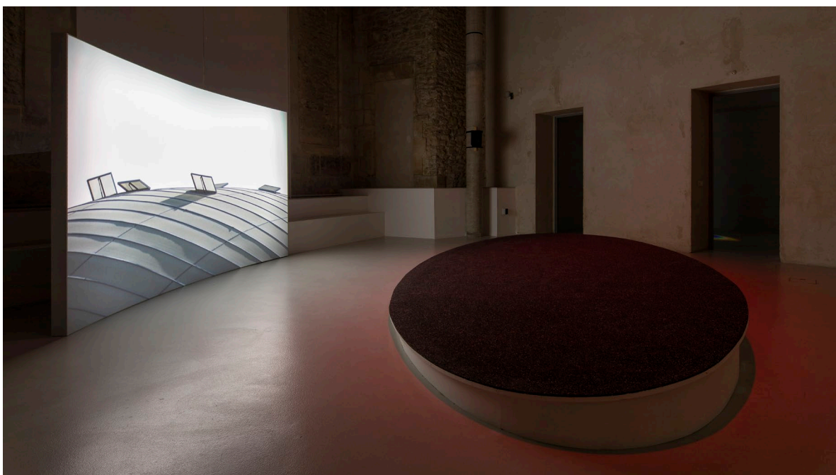
Caroline Corbasson, vue de l'exposition Ellipse , 2020.