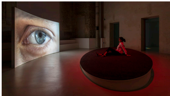
Caroline Corbasson, vue de l'exposition Ellipse , 2020.