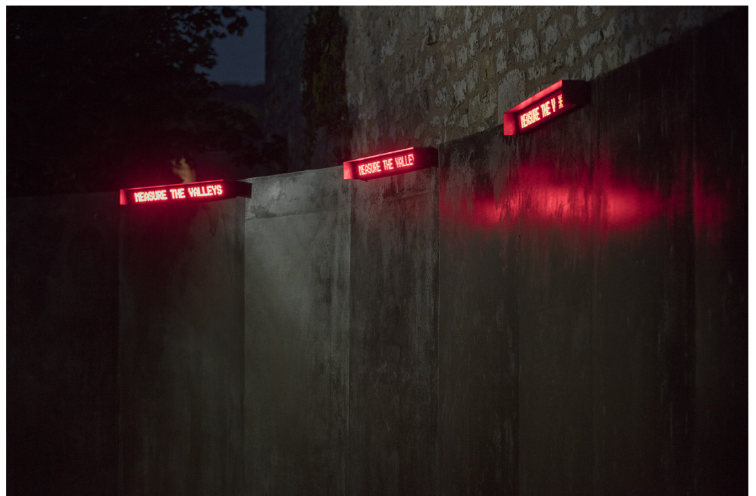
Euridice Zaituna Kala, Trees as Medicines , Installation de 3 panneaux d'affichage LED, Résidences Internationales d'artistes MAGOP, Cajarc, France, 2018.