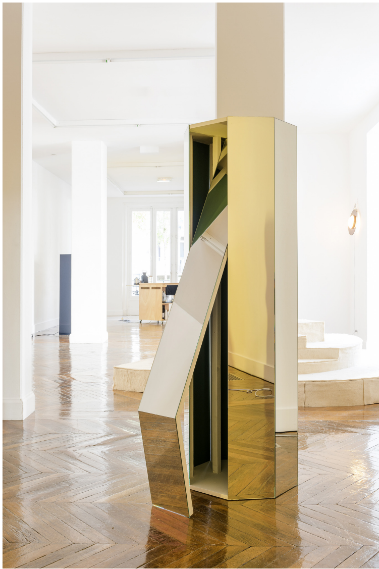
Euridice Zaituna Kala, I have changed in every way, way of it - #2 , Bois divers, miroirs, peintures, citron, 180 x 60 cm, 2018 - Cac-La Galerie, Noisy-le-Sec, Velvet, Thrones, Love.