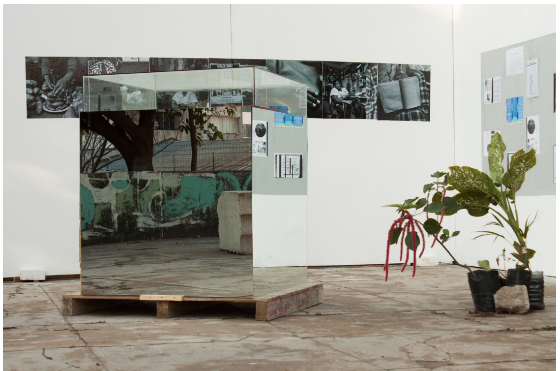
Euridice Zaituna Kala. Will see you in december... Tomorrow. Installation, techniques mixtes, dimensions variables, Museo di arte, Maputo, Mozambique, 2014.

Elle est également la fondatrice et co-organisatrice de e.a.s.t. (Ephemeral Archival Station), un laboratoire et une plate-forme pour des projets de recherche artistique à long terme, établis en 2017.