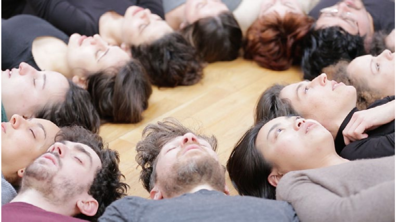
Mercedes Azpilicueta, Paris is breathing [capture d'écran], 2019, vidéo, son, 2 min. 37 sec.