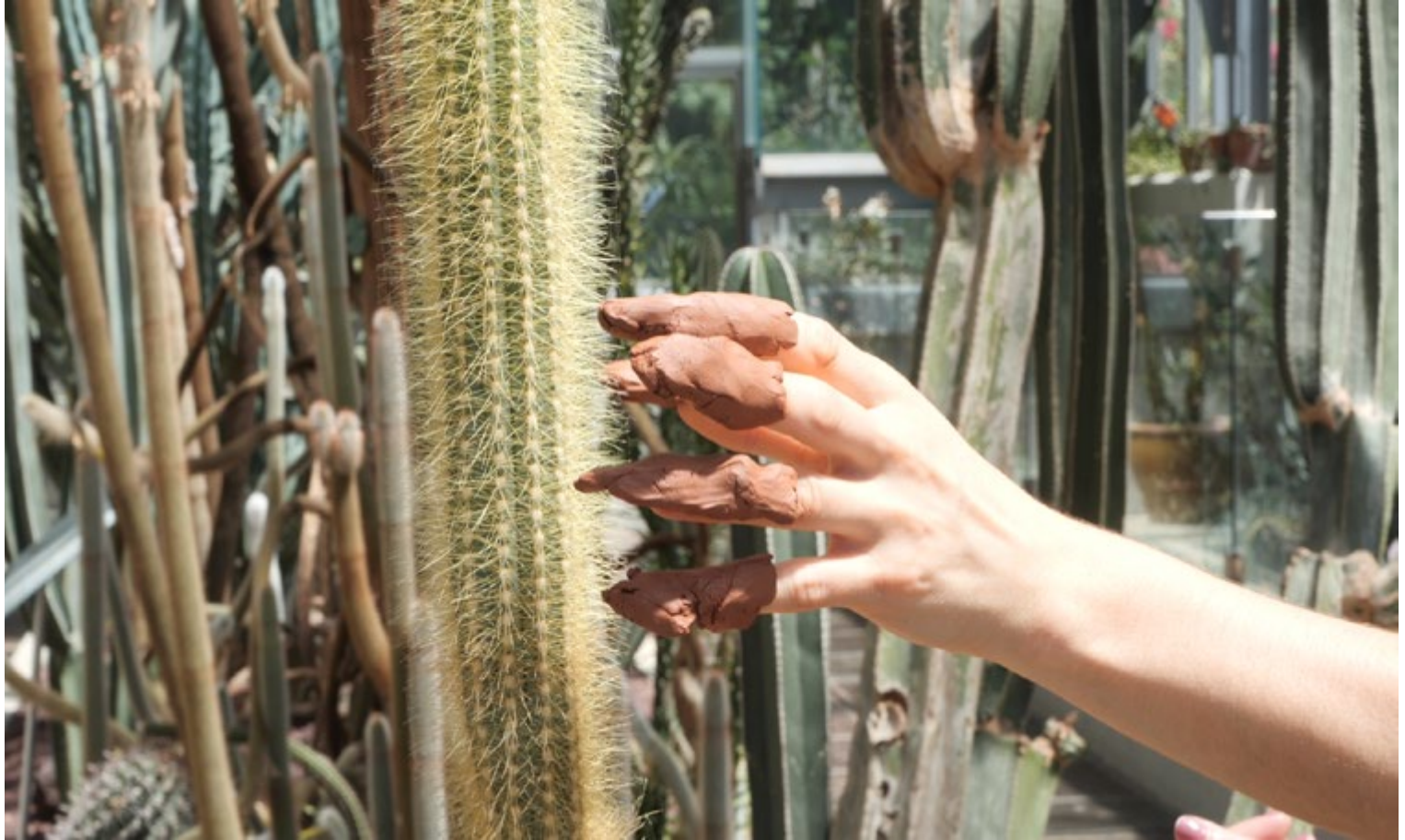
Mercedes Azpilicueta, Mama's Casting a Spell [capture d'écran], 2019, vidéo, son, 7 min. 54 sec.