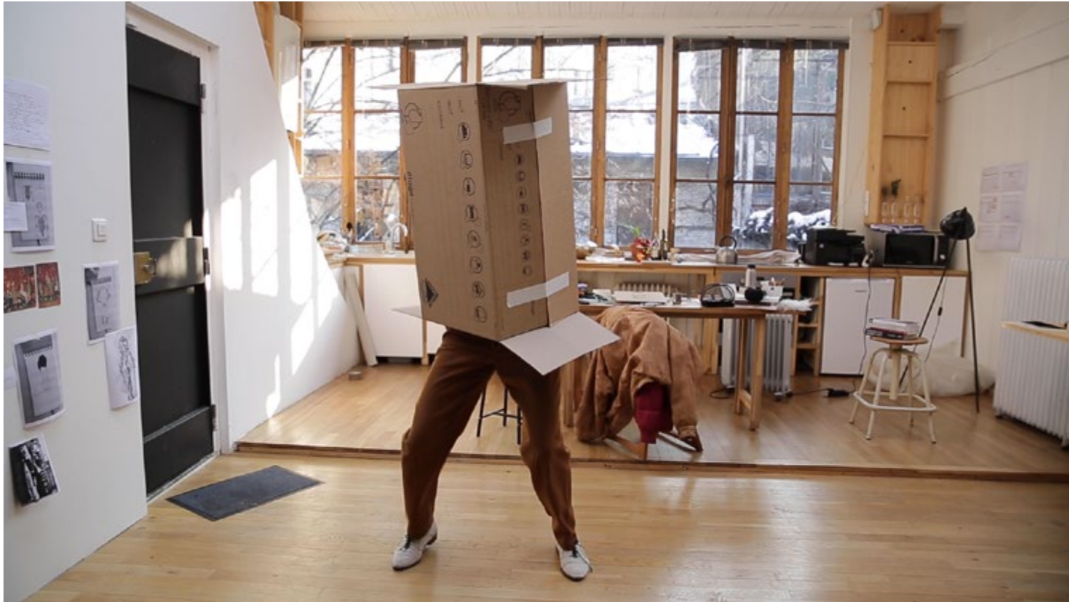
Mercedes Azpilicueta, La Femme-Maison [capture d'écran], 2019, vidéo, son, 2 min. 33 sec.