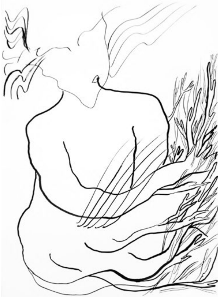
Mercedes Azpilicueta, dessin issu de la série Marginalia , 2018—2020, encre et teinture de cochenille sur papier, 29,7 x 42 cm.