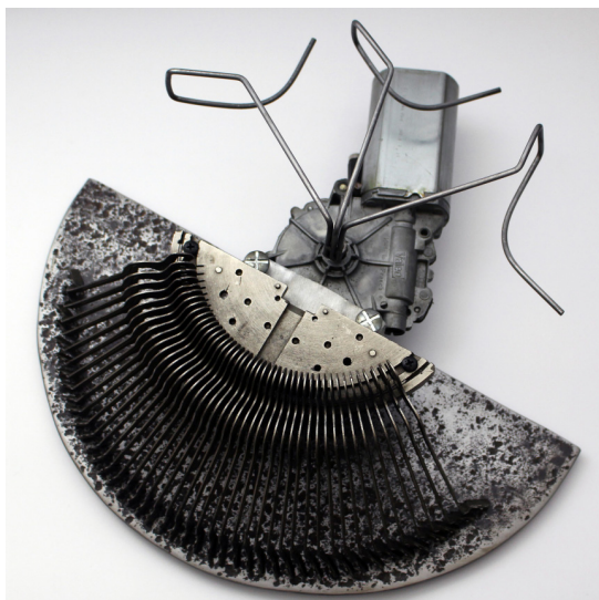
Tanguy Clerc, Circulaire, Pantin , 2021