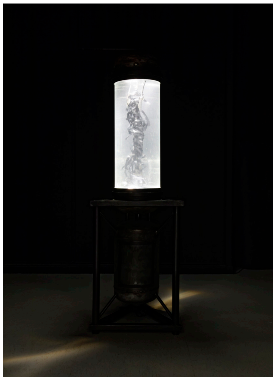
Tanguy Clerc, en collaboration avec Tristan Dubus, Crinoïdophone , 2021

Trois Crinoïdes fous d'une hauteur de deux mètres sont activés par la présence du public et donnent naissance à une forme de ballet improvisé. Les sons émis par les visiteurs activent les bandes magnétiques immergées dans les cuves remplies d'eau. Une relation chorégraphique s'établit entre les déplacements, les bruits et les sculptures qui perçoivent leur environnement grâce à des microphones.